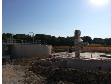
Le bassin d'orage et d'aération