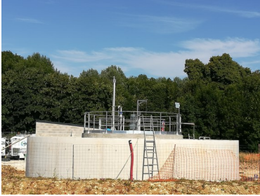
Le bassin d'aération

la partie génie civil sera terminée pour fin juillet 2018. Les différents essais de conformité sont réalisés au fur et à mesure de l'avancement du chantier. les terrassements autour des ouvrages se poursuivent en fonction de la météo. Une première mise en service de la nouvelle station devrait avoir lieu à la rentrée de septembre.