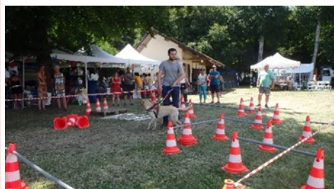
Démonstration du CIE de Vaux le Pénil