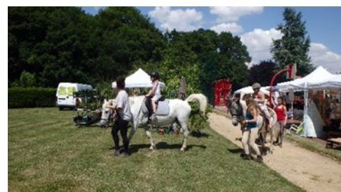
Asso La Randonnée : tour de poney