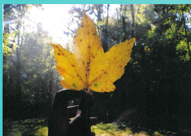
Axel Lanoe pour « Esprit d'automne 2 »

Cette année, les lauréats pour Fontenailles sont :