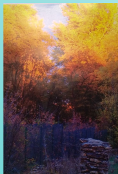
Isabelle Lefebvre pour « Embrassement du soir sur le Bouillot »