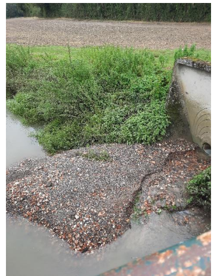
Gravillons dans le ru