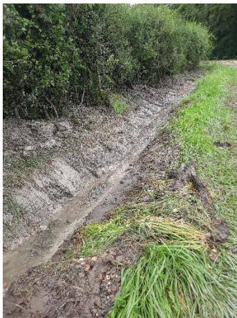
Le fossé est refait