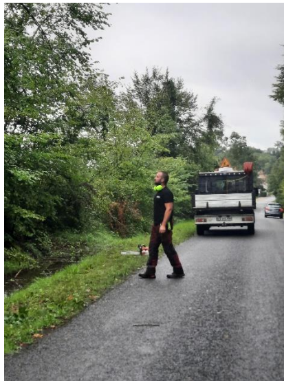
Les arbres sont tronçonnés