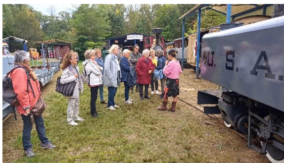
Tacot des Lacs à Grez sur Loing

Info FLAC77 : Yolande METGE propose de vous réunir pour une après-midi « JEUX » à la salle des associations. Belote, tarot, jeux de société, divers et variés... les vendredis après-midi de 14h à 16h30 à partir du 18 octobre. Inscription : Flac77@gmail.com