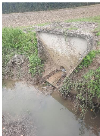
Le ru est dégagé

Madame le Maire les remercie pour ces actes solidaires.