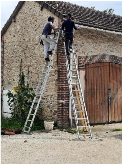
Intervention sur le toit du bâtiment des agents techniques